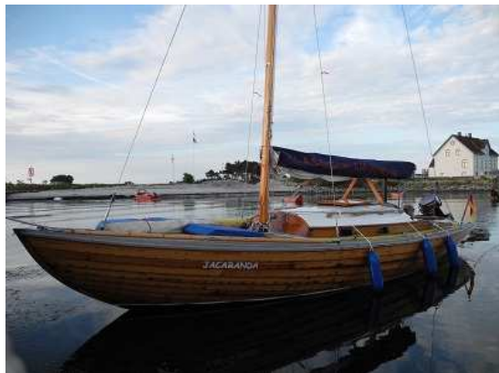
Jacaranda, Baujahr 1946 ältestes existentes dänisches Folkeboot Preisträgerin „Segeln – Lieben – Bewahren“ 2014

E-Mail: info@folkeboot-charter.de , www.folkeboote-charter.de